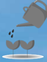
YEŞİL ALAN SULAMA