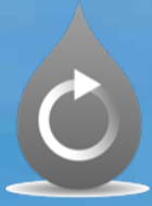
GRİ SU GERİ DÖNÜŞÜM SİSTEMİ