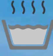
SICAK SU ÜRETİMİ