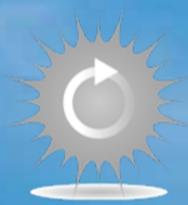
GÜNEŞ ENERJİSİ GERİ DÖNÜŞÜM SİSTEMİ